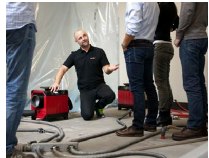
Tijdens onze seminars worden de verschillende droogtechnieken in de praktijk getest. In onze eigen bouwlaboratoria worden theorie en praktijk afgewisseld en wordt een waterschade in verschillende constructies gedroogd en beoordeeld aan de hand van metingen.